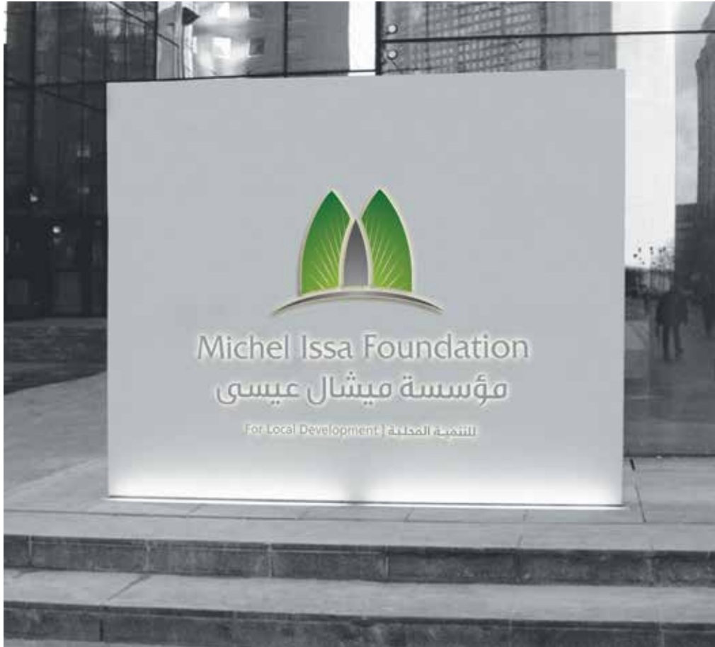
Michel Issa Foundation (for Local Development) , IPT Headquarters, Amchit Highway P.O.Box: 71 Jbeil - Lebanon T: +961 (9) 624 111 F: +961 (9) 624 115 info@mif.org.lb